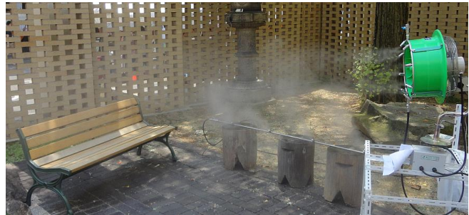
図1 ミストとファンの屋外「クールスポット」

ミストノズルをファンと共に使用（図1）すれば、人間の熱ストレスを軽減できる。熱中症のリスクが高い屋外・半屋外空間（公園、スタジアム、工場など）では、一般のエアコン設備のランニングコストが非常に高い。ミストファンは低コストの熱ストレス対策として使用できる。